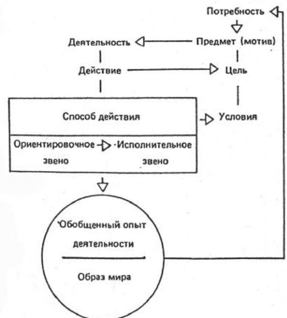
Структура и механизм развития психологического содержания деятельности

Опираясь на собственные психологические исследования, нами было выдвинуто положение том, что деятельность в своем развитии постоянно меняет психологическое содержание в зависимости от обобщения субъектом опыта своей деятельности. Это положение наглядно выражено в предложенной нами схеме, кото-